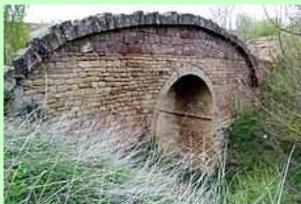
Puente romano sobre el que pasamos en este lance...

Cirauquí es una localidad de 500 habitantes de la merindad de Estella, que está a 30 kilómetros de Pamplona, cuya bonita travesía supone subir un importante repecho para disfrutar de sus calles y lograr un bien merecido sello en la credencial