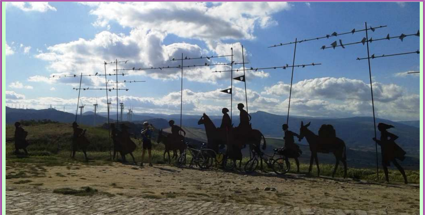
Monumento a los Peregrinos en el Alto del Perdón. Entre Pamplona a Puente la Reina (Gares)